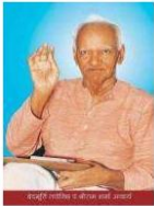
ज्यादा जानकारी यहाँ से प्राप्त करें : http://hindi.awgp.org/about_us